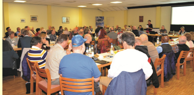
Einen ausführlichen Bericht findet Ihr auf unserer Homepage www.kreuzbund-dv-mainz.de unter „Aktuelles und Berichte“

Für die aktive Mitarbeit bei unserer Gruppenleitungstagung den Teilnehmenden unser herzlicher Dank!